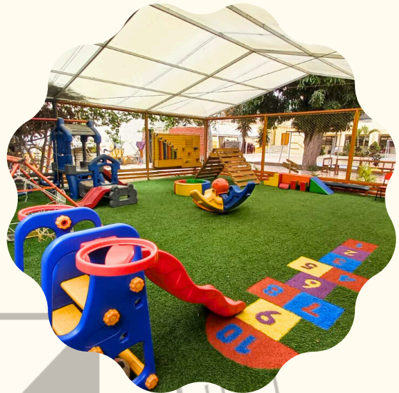
Patio de juegos