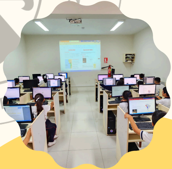
Laboratorio de cómputo