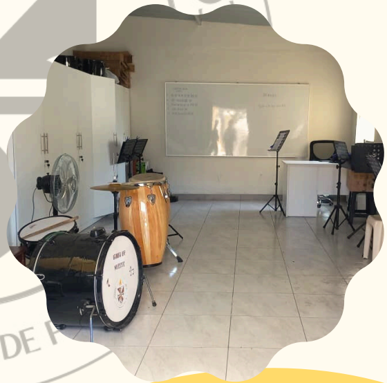
Sala de banda