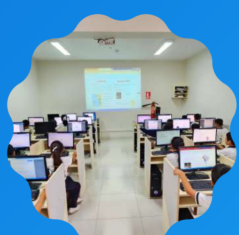
Sala de cómputo