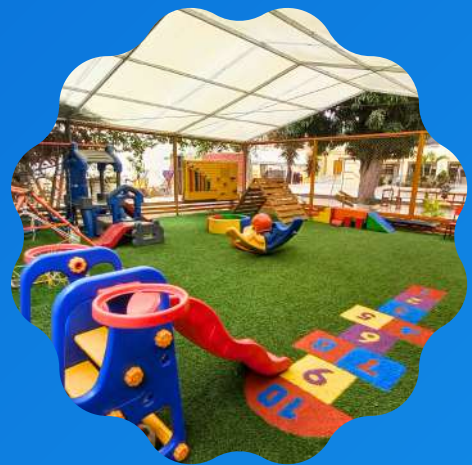
Patio de juegos